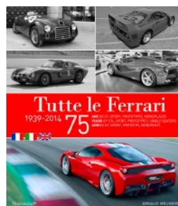
Tutte Le Ferrari